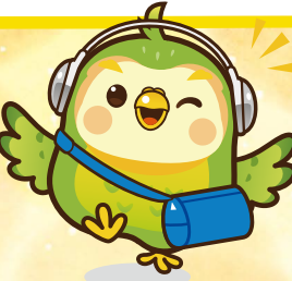
イメージキャラクター「はこ坊」